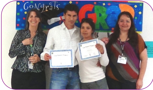
Graduados del Parent Project®

“Esta clase ha sido muy útil para mi, porque he emigrada recientemente de Tonga. Me dio la oportunidad de aprender como criar mis niños en este país.”